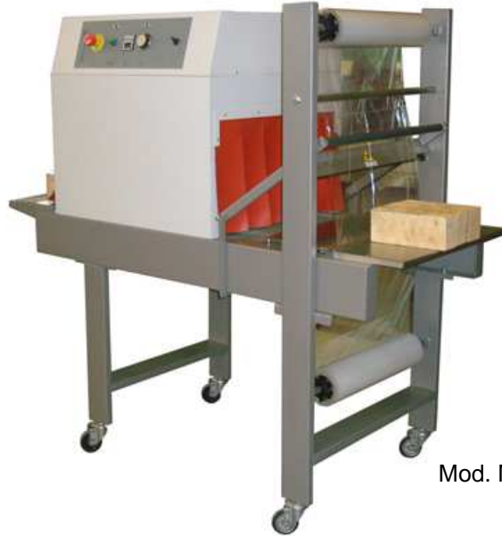
Mod. MA 500 MISTRAL