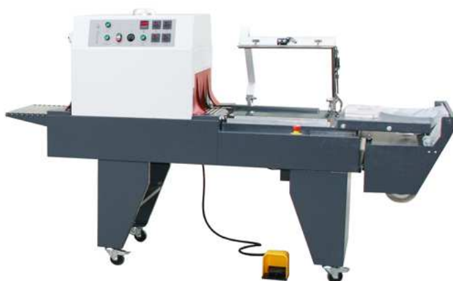
Mod. MATRIX 5040