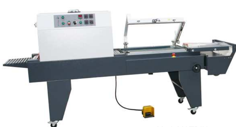
Mod. MATRIX 7550