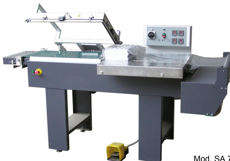
Mod. SA 7050 PNE