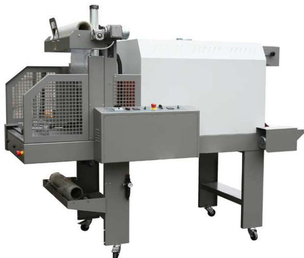
Mod. MA 700 SLIM S